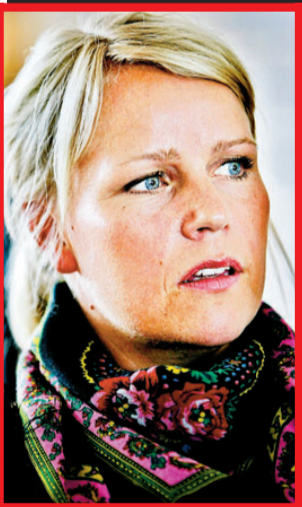
Av HANS KRINGSTAD og ØYVIND NORDAHL NÆSS (foto)

EN HJELPENDE HÅND: Kontrakter, belønning og straff i form av tap av goder skal få «Sara» (16) til å høre etter foreldrene. MST-terapeut Hege