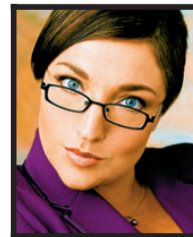
TV-NANNY: Pedagog Jo Frost er et kjent syn på norske skjjermer.

– Jeg følte at enten måtte ungen bort, eller så måtte jeg legges inn i psykiatrien. Det skjedde en forvandling,